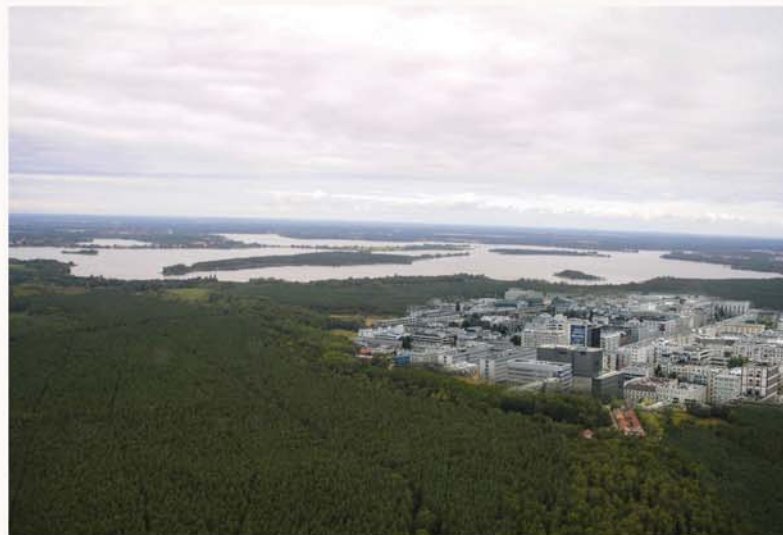
Was wird aus dem ehemaligen Landschaftsschutzgebiet, wenn kein Interessent aus der Freizeitbranche kommt - der Schutzstatus aber unwiederbringlich aufgehoben wurde?

Die Stadtverordneten sind von dieser Idee weiterhin sehr angetan und beschlossen im Mai 2021 für die gleiche Fläche (1.000.000 m 2 ) einen neuen Investor zu suchen.