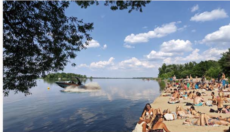
Volle Strände = gute Erholung?

Juni 2020 - Center Parcs, will nahe Wilhelmshof und Eigene Scholle auf über 1.000.000 m 2 einen Ferienpark im Landschaftsschutzgebiet bauen. Die Stadtverordneten sind mehrheitlich begeistert. Der Investor entscheidet sich in Folge für einen anderen Standort.